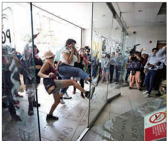
مکزیکو سیتی، مکزیک- معترضان که پس از تجاوز چهار افسر پلیس به یک دختر نوجوان، به دفتر رئیس پلیس این شهر حمله کرده‌اند.