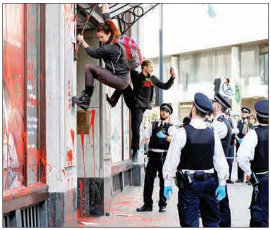
لندن، بریتانیا- مقامات پلیس در حال نظاره‌فعالان محیط زیست که از دیوار سفارت برزیل بالا رفته بودند و حالا پایین می‌آیند.