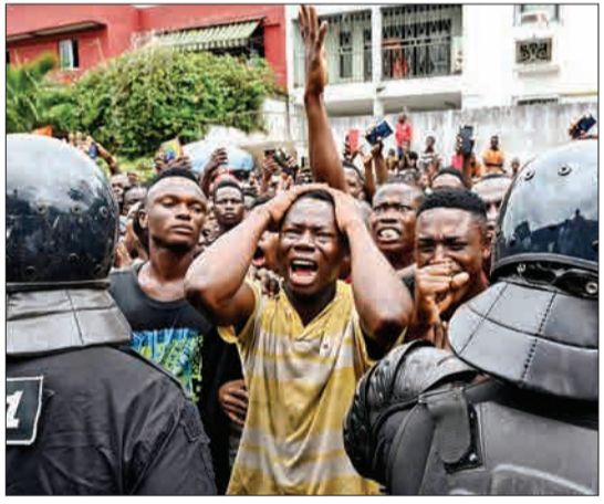
آبیدجان، ساحل عاج- طرفداران یک خواننده ساحل عاجی به نام دی جی عرفات در بیرون از بیمارستانی که او در آن بستری بود، گریه و زاری می‌کنند. دی جی عرفات، در سن ۳۳ سالگی به خاطر تصادف با موتور جان خود را از دست داد.