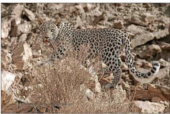
در این تصویر یک پلنگ ایرانی را در موقع رهاسازی در منطقه شکار ممنوع شاهزاده ابراهیم تنگ باهوش، بخش موشکان شهرستان دشتستان استان بوشهر می‌بینید.