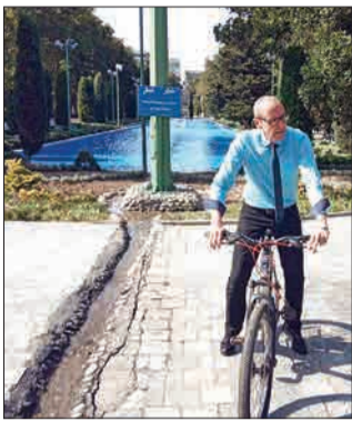
دوچرخه‌سواری اشتفان شولتس، سفیر اتیش در ایران، در پارک شهر را می‌بیند. او به کمپین سمنه‌های بدون خودرو پیوسته که مدتی است شهردار تهران با آن همراه است. (مشرق)