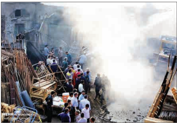
تعدادی از مغازه‌ها و کارگاه‌های چوب‌بری و انبار آنها در بخشی از بازار آه که کمه‌کم قدمت آن به دوران صفویه و قاجار بازمی‌گردد دچار حریق شد و در آتش سوخت.