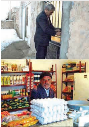
در این تصویر یک بقایای رادر روستای قوزلو از توابع ملکان آذربایجان شرقی می‌بینید که صاحب آن گفته: «شاید وقتی نیت‌مردم چیزی لازم داشته باشند. برای همین ۱۵۰ تاکلید ساختم به همه دادم. خودشان در بازار می‌کنند و هر چیزی لازم دارند، بر می‌دارند و پولش را در دخل می‌گذارند یا در دفتر می‌نویسند.»