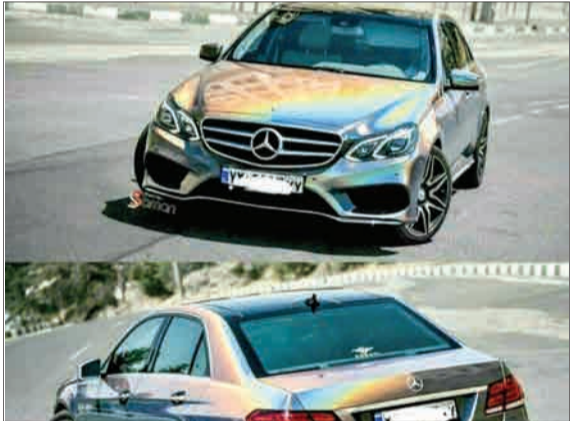
تصویری از یک مرسدس بنز هفت رنگ که حضورش در خیابان‌های تهران توجه‌کاربران فضای مجازی را به خود جلب کرد.