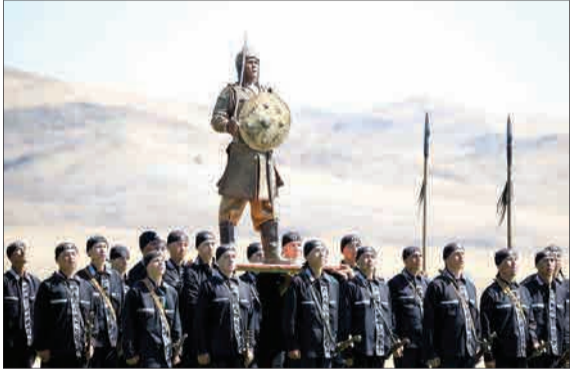
مسابقات بین‌المللی ارتش‌های جهان با شرکت ۲۲۳ تیم از ۳۹ کشور جهان در روسیه برگزار شد و نظامیان در ۳۲ رشته با شش‌گانه و دیگر رقابت کردند. ایران در این دوره از مسابقات با ۱۳ تیم حضور یافت. این تیم‌ها شامل ۴ تیم از سپاه، ۶ تیم از ارتش و ۳ تیم از نیروی انتظامی بود.