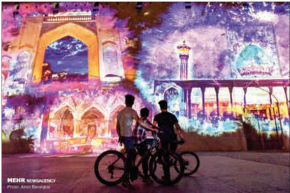
برنامه نورپردازی سه‌بعدی ویدئویینگ از شامگاه ۱۹ مردادماه ۱۳۹۸ به مدت ده شب تاپایان ده‌ولایت در ضلع ورودی مجموعه‌های گنبریمخازند شیراز برگزار می‌شود.