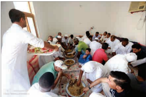
دورهمی هموطنان اهل سنت جزیره کیش به مناسبت عید قربان/ مهر