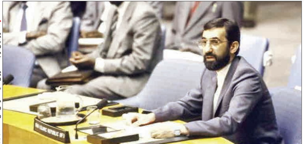
دکتر ولایتی در جلسه شورای امنیت سازمان ملل متحد - ۱۳۶۷

«۱۴۰۷، ۵۱۴، ۵۲۲، ۵۴۰، ۵۵۲، ۵۸۲، ۵۸۸، ۵۹۸، ۶۱۲، ۶۱۶، ۶۱۹، ۶۲۰، ۶۳۱، ۶۴۲، ۶۵۱، ۶۷۱، ۶۷۶، ۶۸۵» اعدادی که خوانندید شماره قطعنامه‌هایی است که در طول جنگ ایران و عراق از سوی شورای امنیت سازمان ملل متحد صادر شد. نخستین آنها ۷ روز پس از آغاز حمله عراق به ایران و آخرین شان نیز ۳۰ ماه پس از پایان آن در شورای امنیت رای آوردند تا نقطه پایانی باشد بر یکی از طولانی‌ترین جنگ‌های کلاسیک قرن بیستم. اما این که چرا ایران به‌عنوان یکی از طرف‌های درگیر به اکثر قطعنامه‌های صادر شده و بندها و تبصره‌های آنها بی‌توجهی کرده و نهایتاً قطعنامه ۵۹۸ را یک سال بعد از صدور پذیرفت به بندی برمی‌گردد که در هیچ یک از این قطعنامه‌ها به آن کوچکترین اشاره‌ای نشده بود: «معرفی و تشبیه متجاوز!» دعوت به صلح یا جایزه به متجاوز؟ درست ۷ روز پس از آغاز جنگ و در حالی که ماشین جنگی عراق به میزان قابل توجهی در خاک ایران پیشروی کرده بود، شورای امنیت سازمان ملل متحد که گویی تازه از خواب بیدار شده بود ۶ مه ۱۳۵۹ نخستین قطعنامه خود با موضوع جنگ ایران و عراق را با شماره ۴۷۹ صادر کرد. در این قطعنامه که رأی موافق هر ۱۵ عضو شورا یعنی آمریکا، شوروی، انگلستان، فرانسه، چین، آلمان شرقی، بنگلادش، مکزیک، جامائیکا، نروژ، نیجر، فیلیپین، پرغال، تونس و زامبیا را پشت خود داشت از ایران و عراق خواسته شده بود مشکلات خود را از راه‌های