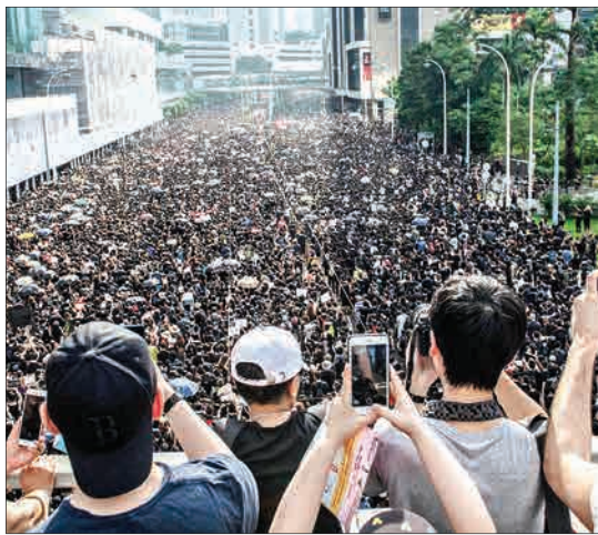
هنگ کنگ - مردم در حال عکس گرفتن از جمعیت معترض علیه قانون استرداد مجرمین به چین هستند.