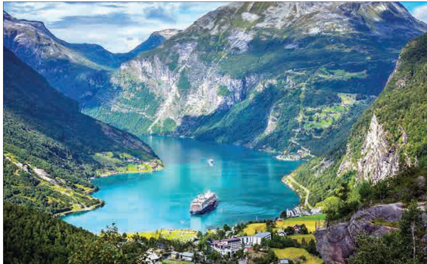
در ۸ پارامتری که برای سنجش شادی در نظر گرفته شده، آنها پیشقراولند