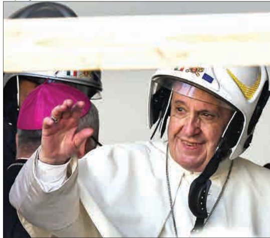
کامریون، ایتالیا - پاپ فرانسیس با پوشیدن یک کلاه ایمنی، وارد کلیسایی شده که در ۲۴ اکتوبر ۲۰۱۶ به خاطر زمین لرزه آسیب دیده است.