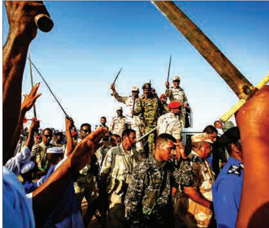
سودان - ژنرال محمد حمدان داکلو معاون شورای نظامی انتقالی سودان در میان طرفدارانش.