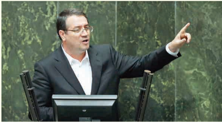
محمد رضا منصوری، نماینده سواد در مجلس شورای اسلامی

کشور به بخش خصوصی واگذار نشود، اوضاع بر همین منوال سیری خواهد شد و شاید از این بدتر هم شود. باید بی‌ذریعیم که کارخانه‌های خودروسازی ما زمین خوردند و با ادامه این روند آنها نابود خواهند شد و مرگشان حتمی است اما متأسفانه به اسم حمایت از تولید داخل در بخش خودروسازی، شاگردان تنبلی بار آورده‌ایم که می‌خورند و می‌خوابند و توان این اتفاقات را هم فقط و فقط مردم پس می‌دهند.»