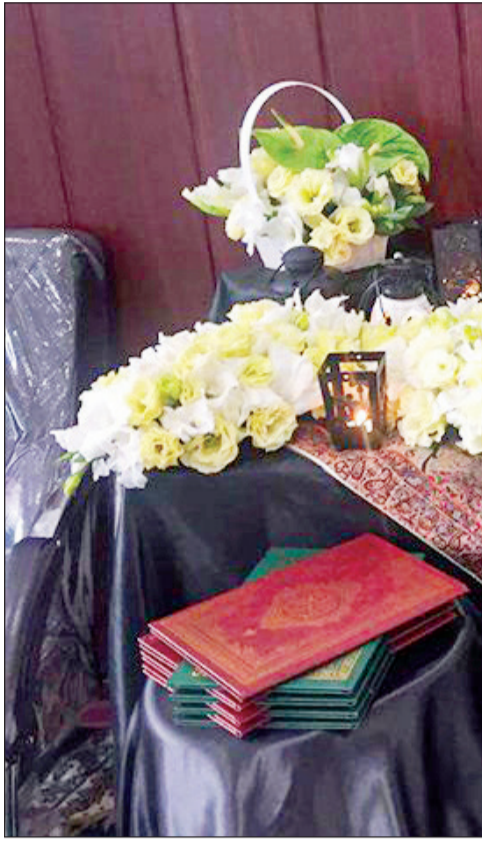
بازار بود و با آب طلا روی آن نوشته شده بود «او ادامه می‌دهد:»

بازار بود و با آب طلا روی آن نوشته شده بود «او ادامه می‌دهد:» در حال حاضر گران‌ترین سنگ موجود در بازار مرمر سبز است؛ البته به تازگی نوعی سنگ برزیلی به بازار آمده که بهتر از انواع داخلی است و کیفیت بالایی دارد. این سنگ‌ها در مقابل سرما و گرمای هوا مقاومت بیشتری دارند و قیمتشان از ۵ میلیون تومان آغاز می‌شود. برخی از مشتریان نام سفارش گل کاری یا ساخت باغچه را بر سر مزار عزیزان خود می‌دهند که قیمت این باغچه‌ها هم از ۵ میلیون تومان به بالا است.»