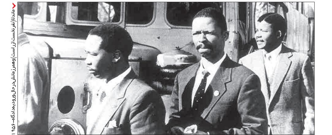
ماندلا (توسط نخست‌از است) و همسرش وینا در حال ورود به دادگاه - ۱۹۵۶

۱- از صفات باری تعالی - از دانه‌های روغنی ۲- شش - دست نخورده - شوم ۳- تیره شدن - عقل و فهم - اردوگاه - کاغذ روزنامه ۴- گرفتار - کشتی ۵- علامت مصدر جمعی - واحد شمارش پارچه - صدمتر مربع - ایوانش آینه عبرت است ۶- سخن بیهوده - تند - پروردگار ۷- هر مثلی دارد - بیننده ناظر - مادر لر ۸- نیمه تاریک زمین - غیر والا