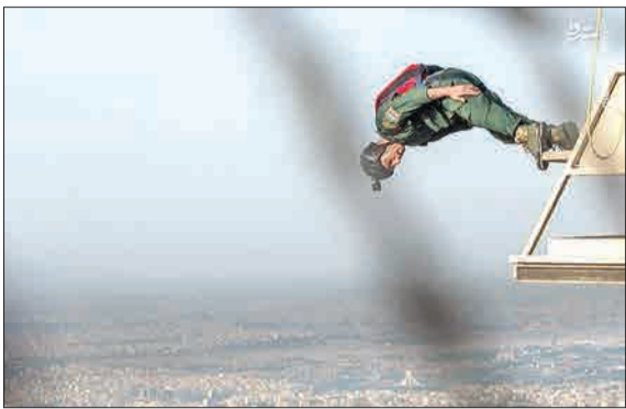
به مناسبت سوم خرداد ماه، سالروز آزادسازی خرمشهر و عملیات غرورآفرین بیت‌المقدس، روز مقاومت، ایثار و پیروزی، پرواز اقتدار ۱۵ نفر از متخبان و خیرگان تکاوران چترنیز نیروی دریایی، نیروی قدس، بسیجیان و تکاوران سپاه تهران بزرگ اقدام به پرش بیس جامپ از برج میلاد کردند.