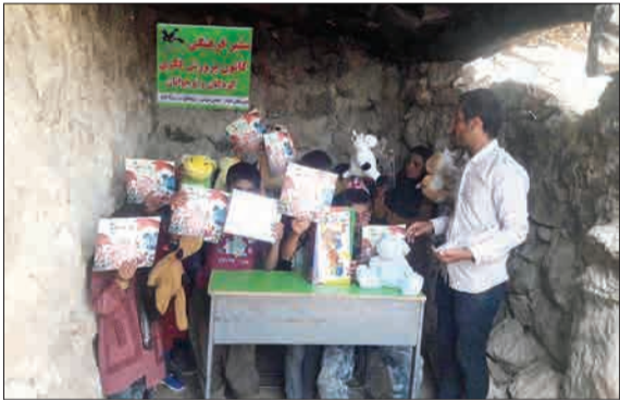
کلاس درس چپ‌های روستای «درب کاظم» بخش «سوسن» شهرستان ایذه، دخمه‌ای کوچک در داخل کوه است.