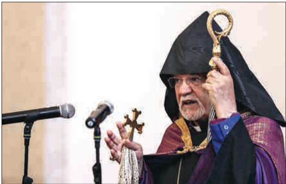
مراسم گرامی‌داشت سالگرد رحلت امام خمینی (ره) از سوی شورای خلیفه‌گری ارمنه روز جمعه سوم خرداد در کلیسای سرکسیس مقدس تهران برگزار شد.