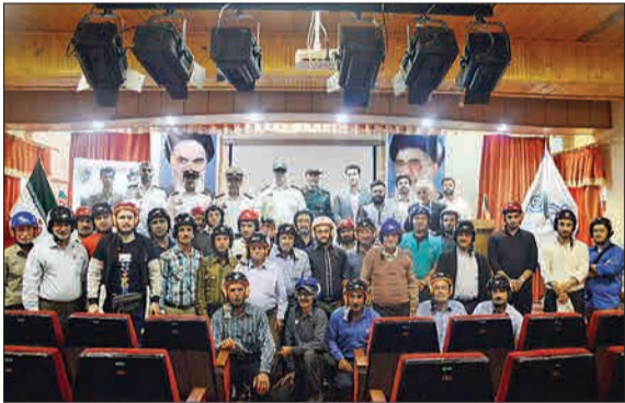
۵۰ کلاه ایمنی به موتورسیکلت‌سواران کلاچای کپلان اهدا شد. خریداری این کلاه‌های ایمنی به ارزش ۷ میلیون تومان به همت شهرداری کلاچای و پلیس راهور شهرستان رودسر انجام شد. (صنعت ایران)