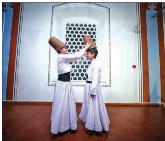
ترکیه - کودکانی که برای یک مراسم عرفانی آماده می‌شوند.