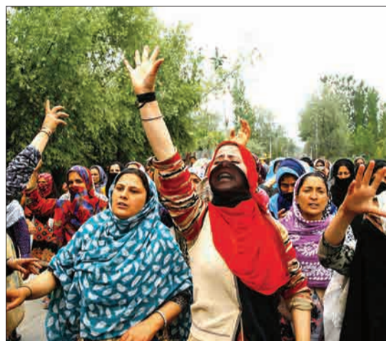
دومین روز اعتراضات در کشمیر هند به تجاوز به یک بچه