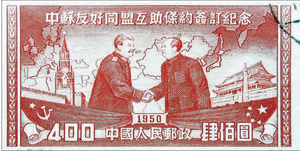
استالین و مانو روی تصویر چپ - چین - ۱۹۵۰

با تشکیل جمهوری خلق چین در سال ۱۹۴۹ میلادی که با فراق ژنرال چیانگ کای‌شک ملی‌گرا به تایوان و تکیه زدن مانو تسه‌تونگ کمونیست بر صندلی رهبری چین همراه بود، بیشترین حظار اتحاد جماهیر شوروی برد، دلیل خوشحالی شوروی یا به عبارت بهتر استالین این بود که مسکو کمک‌های قابل توجهی را در جریان جنگ داخلی چین به کمونیست‌ها ارائه کرده و حالا که مانو و پارتاش موفق شده بودند، ملی‌گراها را به تایوان عقب برانند، انتظار داشت کمونیست‌های چینی خود را برای همیشه زیر بلیت برادر بزرگتر یعنی اتحاد جماهیر شوروی قرار دهند. اما این پنداری