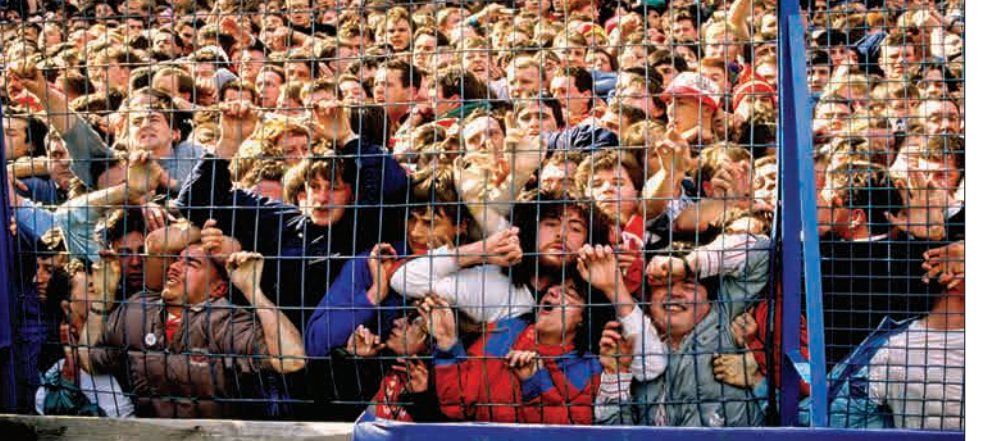
از دحام جمعیت و فشرده شدن تماشاگران به فتنه‌های ورزشگاه هیلز بورو - ۱۹۸۹

۳۰ سال پیش در چنین روزی، برابر ۱۵ آوریل ۱۹۸۹ میلادی، در جریان برگزاری مسابقه فوتبال بین تیم‌های لیورپول و ناتینگهام فارست در نیمه‌نهایی جام حذفی فوتبال انگلستان، از دحام جمعیت منجر به مرگ ۹۶ نفر از حاضران در ورزشگاه هیلز بورو شد. این حادثه که در تاریخ به «فاجعه هیلز بورو» معروف شده است، ۴ سال بعد از فاجعه ورزشگاه هیسل بلژیک به وقوع پیوست و موجب بدنامی بیش از پیش طرفداران فوتبال در انگلستان شد. در فاجعه ورزشگاه هیسل بروکسل (پایتخت بلژیک) که ۲۹ می ۱۹۸۵ جهان را در شوک فرو برد، در جریان برگزاری مسابقه