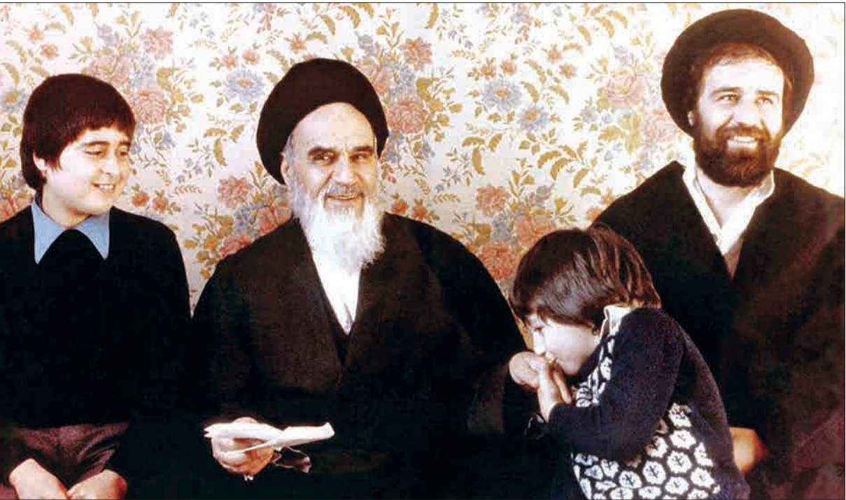
سید احمد خمینی در کنار امام (ره) ۲۴ سال پیش در چنین روزی، برابر ۲۵ اسفند ۱۳۷۳ خورشیدی، حجت‌الاسلام سید احمد خمینی، دومین فرزند امام خمینی (ره)، بر اثر عارضه سکته مغزی در گذشت. پیکر او یک روز بعد از دانشگاه تهران تاب پشت زهر تشییع و در کنار پدر بزرگوارش به خاک سپرده شد.