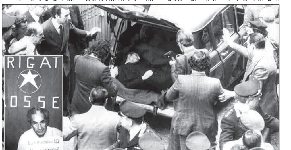
یافتن جسد آلدو مورو و هم‌روز بعد از ریاض ۱۹۷۸

۴۱ سال پیش در چنین روزی، برابر ۱۶ مارس ۱۹۷۸ میلادی، انتشار یک خبر موجی از حیرت در جهان به راه انداخت و فضای سیاسی ایتالیا و اروپا را تا مدت‌ها تحت تأثیر خود قرار داد. خبری که از روده‌شدن آلدو مورو، نخست‌وزیر وقت ایتالیا توسط گروه تروریستی چپ‌گرای «بریگاد سرخ» و انتقال او به مکانی نامعلوم حکایت داشت. در اساننامه گروه بریگاد سرخ بر تشکیل حکومت کمونیستی انقلابی در ایتالیا و خروج این کشور از پیمان امپریالیستی ناتو تأکید شده بود و به همین خاطر بودن نخست‌وزیر