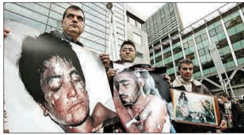
فصلی دیگر در دهکده آفات