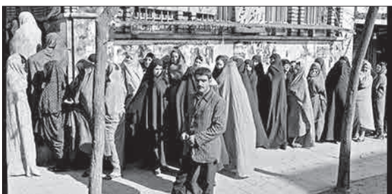
روز گذشته سالگرد نخستین دوره انتخابات مجلس شورای اسلامی بود.