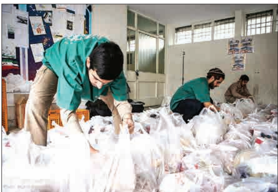
مجموعه خیریه «دوشنبه های امام حسن (ع)» هر سال در آستانه عید نوروز با همت و تلاش مردم و خیرین اقدام به تهیه سبد مواد غذایی و توزیع میان نیازمندان می کند. این کار خیریه در طول سال هم هر دوشنبه شب در مناطق محروم تهران از سوی این خیریه در جریان است.