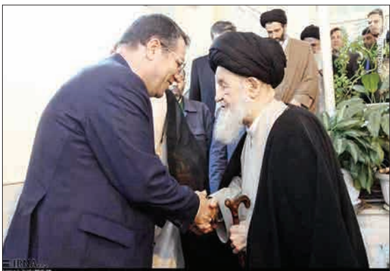
رضا رحمانی، وزیر صنعت، معدن و تجارت روز پنجشنبه در سفر به استان قم با علما و مراجع تقلید دیدار و گفت و گو کرد.