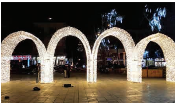
«جشن نور تهران» در استقبال از بهار در بوستان ملت تهران آغاز شده. در این جشن ۲۸ طرح با تجهیزات نوری با الهام از نقش مایه ها و معماری ایرانی اسلامی در ابعاد شهری طراحی و اجرا شده اند. کبریا آلچقچ، چادر عشایر، طاق بستان، نور گام، تذهیب، هفت سین، شیر سنگی و... از جمله آثار نوری دیدنی در «جشن نور تهران» است. (خبر آنلاین)