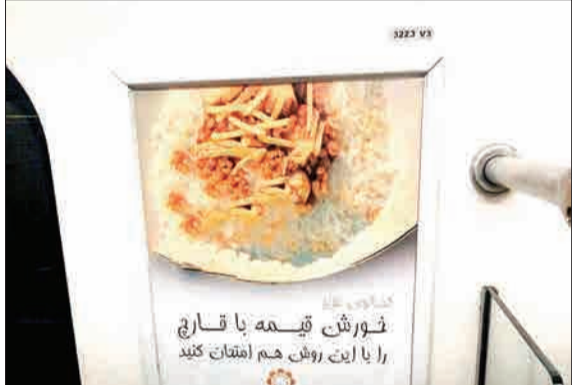
تبلیغ این روزهای مترو تهران - (عمر امیران)