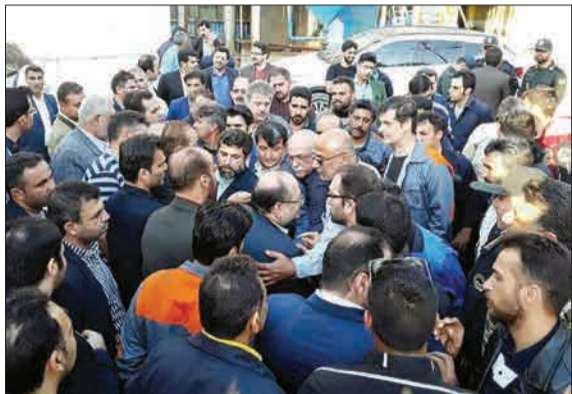
حضور وزیر کار در جمع کارگران شرکت نیشکر هفت تپه.