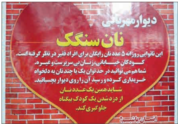
اقدام پرسنل دیده بانوایی سنگ در شاهرود.