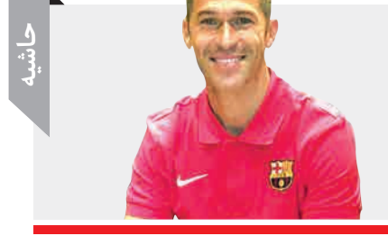
راز حضور ستاره لالیگا در ایران

آنهایی که طرفدار برنامه فوتبال ۱۲۰ هستند، پنجشنبه شب از حضور لوییس گارسیا، ستاره سابق بارسلونا در ایران و مصاحبه‌اش با عادل فردوسی پور تعجب کردند. بازیکن سابق بارسا، لیورپول و اتلتیکو مادرید اما برای مشارکت در کمپ استعدادیابی ایرانسل با همکاری لالیگا به ایران سفر کرده است. او در این خصوص گفته است: «امروز این جاهستیم تا برای این پروژه مشترک در کنار بازیکنان تمرین کنیم و این افتخار را داریم تا کلیتیک استعدادیابی بازیکنان جوان را در این کشور در کنار یکدیگر تأسیس کنیم. مهمترین نکته دادن شانس و فرصت به بچه‌هایی است که روز استعدادهای آنهاست.»