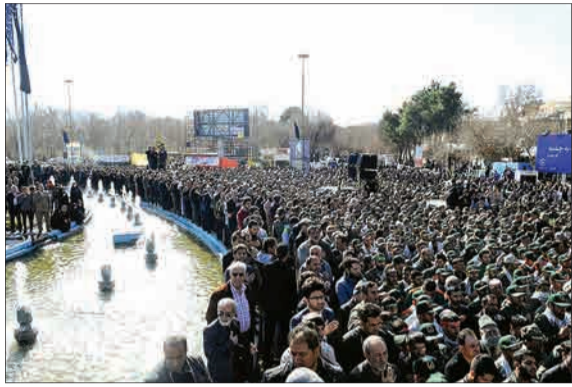
تشییع پیکر شهدای حادثه تروریستی سیستان و بلوچستان در اصفهان.