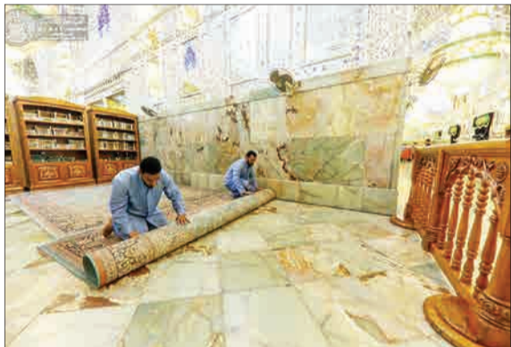
حرم مطهر امیرالمؤمنین (ع) به همت خادمان آستان علوی غبارروبی شد.