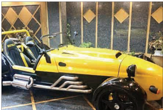
در یک سایت داخلی خرید و فروش خودرو در تهران، خودروی «وست فیلد» به قیمت یک میلیارد و ۲۰۰ میلیون تومان به فروش گذاشته شده (عصر ایران)