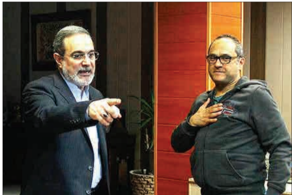
رامبد جوان، بازیگر، کارگردان و برنامه‌ساز سینما و تلویزیون، صبح امروز با حضور در دفتر سید محمد بطحایی، وزیر آموزش و پرورش به تشریح چند طرح ابتکاری با هدف افزایش نشاط کودکان و نوجوانان پرداخت.