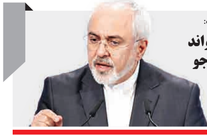
محمدجواد ظریف، وزیر خارجه کشورمان در کنفرانس امنیتی مونیخ در پاسخ به سوالی مبنی بر این که برخی از کشورهای اروپایی از جمله فرانسه معتقدند که ایران باید در ارتباط با فعالیت‌های موشکی خود به صورت جداگانه با اروپایی‌ها مذاکره کند، گفت: «ایران باید مثل مرده دراز بکشد و به همه خواسته‌ها تن بدهد» ظریف در ادامه با تأکید بر این که من برای راضی کردن آقای لودریان (وزیر خارجه فرانسه) کشورم را بی دفاع نمی‌کنم، تا کسانی در منطقه بیایند و مردم ما را بکشند و به آنها آسیب برسانند، گفت: «هنوز مردم زیادی در کشور ما هستند که به خاطر سلاح‌های شیمیایی که اروپایی‌ها در اختیار صدام قرار دادند، اذیت هستند. اگر اروپایی‌ها می‌خواهند با ما مذاکره کنند، نمی‌توانند در نقش بازجو عمل کنند و ما را محاکمه کنند.»