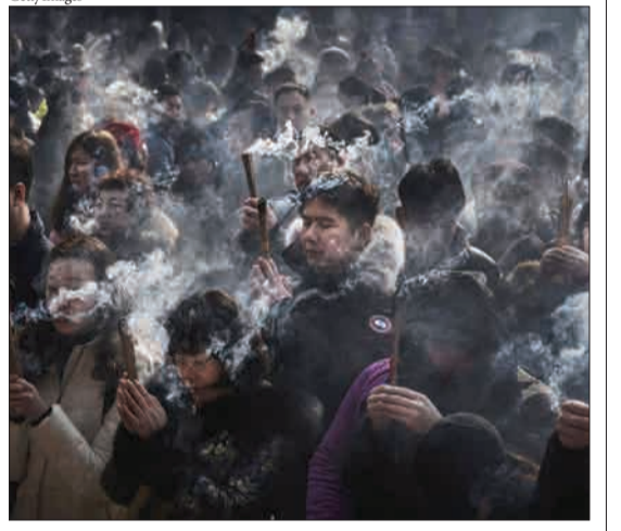
پکن، چین - مردمی که برای آینده خوب در اولین روز سال جدید در معبد لامادعا می‌کنند