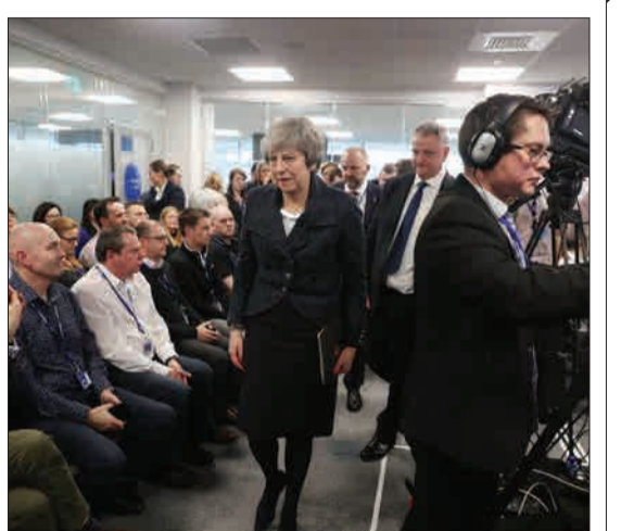
بلغفاست، ایرلند شمالی - تراز می خود را برای سخنرانی در مورد مرزها پس از برگزیت آماده می‌کند.