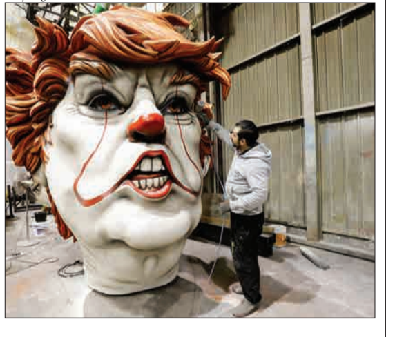
نیس، فرانسه - کارگری که در حال کار بر روی مجسمه ترامپ برای کارناوال نیس است.