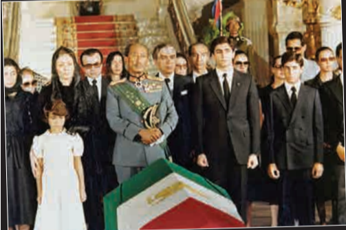
مراسم تشییع جنازه محمدرضا شاه پهلوی در مصر / حضور انور سادات