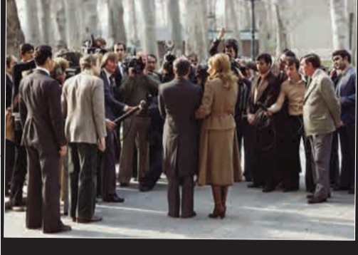
احکامات پیش از ترگ تهران

(۱۳۵۸) با یک هوای پیمایی باری ۲۹ نیویورک می‌آید و از پاناما لک‌لند را به مقصد پاناما ترک کرد و در فرودگاه هوارا واقع در یکی از پایگاه‌های نظامی آمریکا فرود آمد. میزان شاه و صادرکننده ویزای او رهبر نظامی پاناما عمر توریخوس بود.