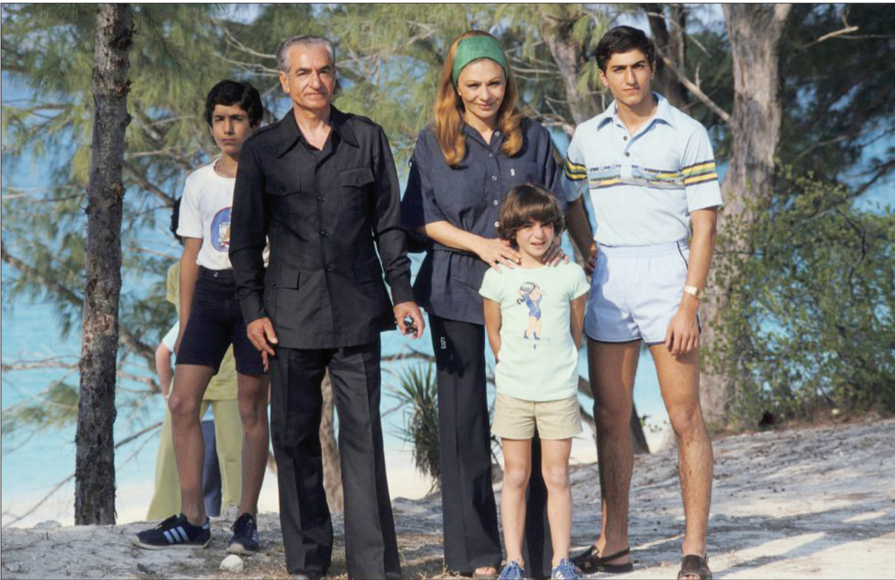
عکس خانوادگی در جزیره پارادیس

در مورد اموال و پول‌هایی که محمدرضا شاه با خرویش از ایران با خود برد، حرف و حدیث‌های زیادی وجود دارد. روزنامه‌فایننشال تایمز در گزارشی اعلام کرده بود که او ۳۵ میلیارد دلار دارایی از ایران خارج کرده است. دیوید فراس، خبرنگار انگلیسی در دی ماه ۵۸، زمانی که شاه در پاناما بود از او سوال کرد: «مطالبه ۵۶ میلیارد دلاری که آنها ادعا می‌کنند ۲۰ میلیارد دلار را برای مصارف شخصی برداشته‌اید و سپس وزیر خارجه این مقدار را به ۶ میلیارد دلار کاهش داد. شما چقدر ثروت دارید؟» شاه در پاسخ گفت: «من تعجب می‌کنم که آنها از این مقدار حرف می‌زنند.» او در نهایت در پاسخ به این سوال گفت: «من خیلی خیلی خیلی کمتر از میلیون‌ها دلار آمریکایی پول دارم.»