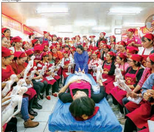
هایکو، چین - یک معلم طب سنتی چینی به دانشجویانش آموزش می‌دهد.