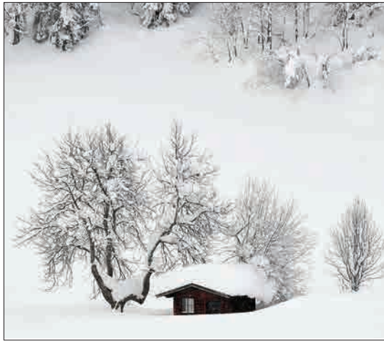
فیلمتوس، اتریش - کلبه کوچکی که با برف پوشیده شده است. در بسیاری از مناطق اتریش، آلمان، سوئیس و شمال ایتالیا برف سنگینی باریده است.