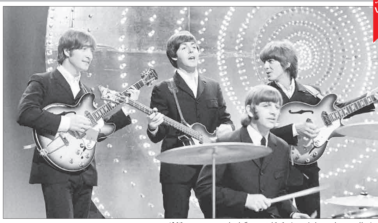
بیتل‌ها از چپ به راست: جان لئون، پل مک کارتنی، رینگو استار، جرج هریسون - ۱۹۶۴ ۵۶ سال پیش در چنین روزی (۱۷ اکتبر ۱۹۶۲)، گروه موسیقی «بیتلز» برای اولین بار در یک شبکه تلویزیونی ظاهر شده و به اجرای برنامه پرداختند. بیتل‌ها در دهه ۶۰ میلادی فعالیت موسیقی خود را آغاز کردند و بعد از ۱۰ سال همکاری، در سال ۱۹۷۰ از هم جدا شدند. آن‌ها پر فروش‌ترین گروه موسیقی در جهان با فروش بیش از ۶۰۰ میلیون دلار هستند.