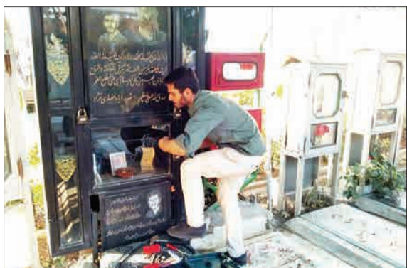
جمعی از جوانان فعال بیش از یک سال است که اقدام به خانه‌تکانی صلواتی گلزار شهدای بهشت‌زها (س) تهران می‌کنند.