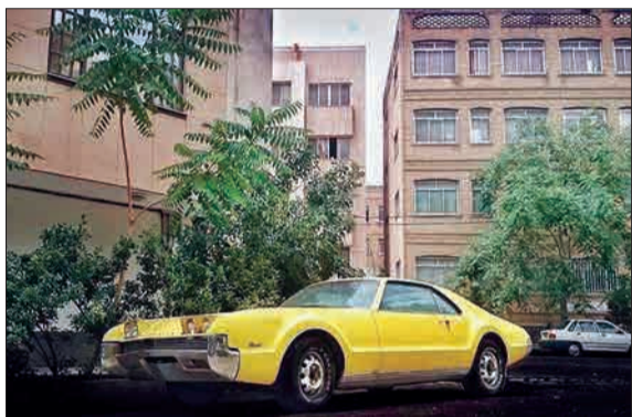
خودروی کلاسیک آمریکایی به نام «اولدزموویل تورنادو»، مدل سال ۱۹۶۶، در خیابان‌های تهران (خبر آنلاین)