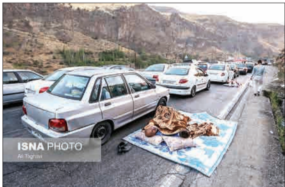
تعطیلات چند روز اخیر، جاده‌های شمالی را به مرز انفجار ترافیکی رساند. تا جایی که خیلی از مسافران کنار جاده شب را به میخ‌سازند و در ترافیک ماندند. (ایستا)