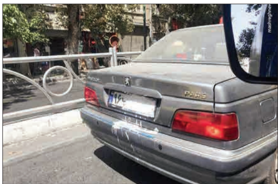
تصویری عجیب از خودروی پرشیا که برای ورود به طرح ترافیک پلاک خود را گچ‌گرفته است!