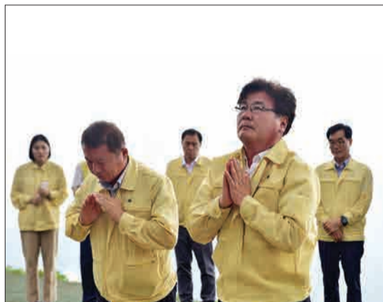
یونگ‌وول، کره جنوبی - با افزایش موج گرما و خطر خشکسالی، مقامات کشور مراسمی را در بالای کوه به منظور آمدن باران برگزار می‌کنند.