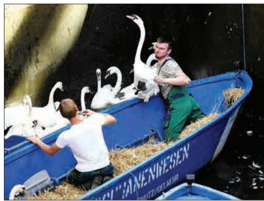
هامبورگ، آلمان - کارگران در حال گرفتن قوها هستند تا آنها را به مکانی خشک‌تر ببرند.