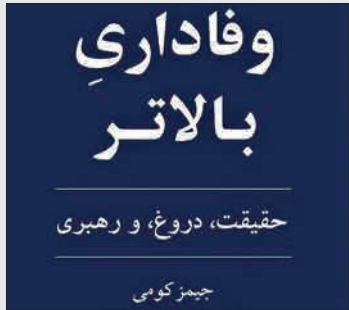
وفاداری بالاتر، جیمز کومی