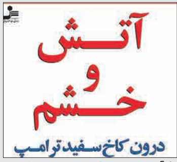
آتش و خشم، درون کاخ سفید ترامپ از مایکل ولف