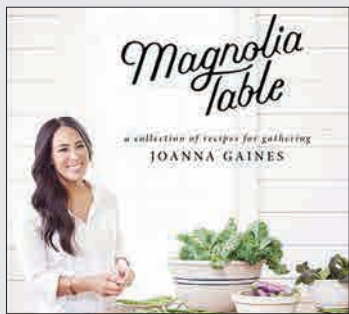
میز مگنولیا از جوناگینس