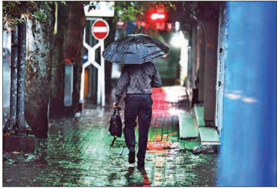
▲ بارش باران تابستانی در گرگان.