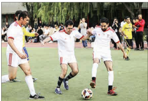
▲ مسابقه فوتبال تیم هنرمندان با تیم انجمن اوتیسم.