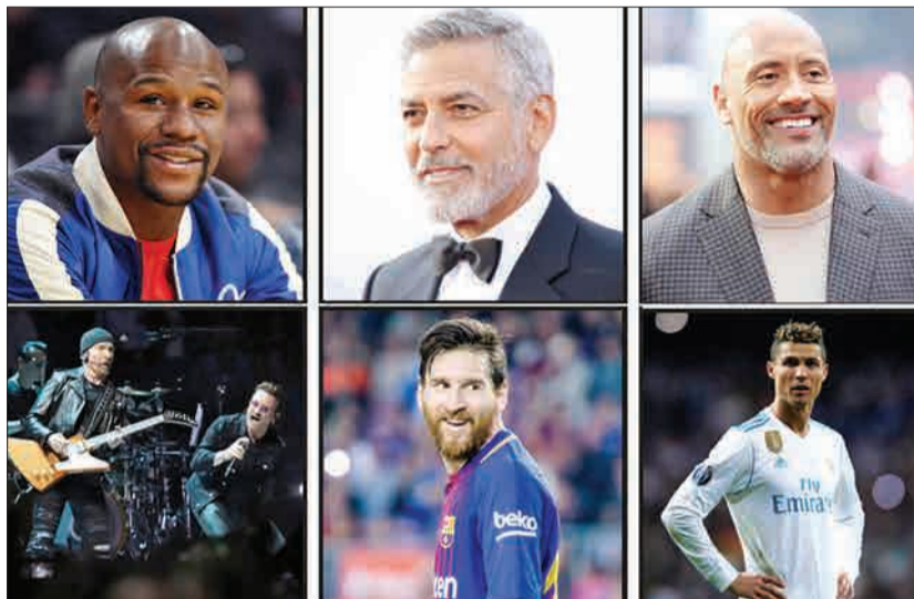
پر درآمدترین سلبریتی‌ها در سال ۲۰۱۸