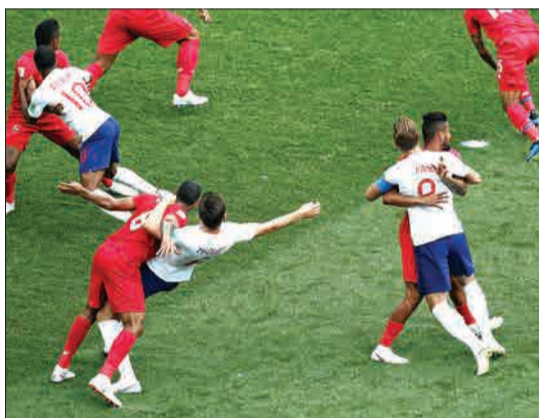
هری کین، رحیم استرلینگ و هری مک گویار، بازیکنان تیم انگلستان که توسط مدافعان تیم پاناما گرفته شده‌اند. گرچه برای پانامایی‌ها این کارها خیلی نتیجه‌بخش نبود و انگلیس نهایتاً بر یک پیروز شد.