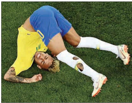
نیمار، مهاجم تیم برزیل در حال غلت زدن در بازی با سویس در ورزشگاه روستوف آرنا، البته این آخرین باری نبود که نیمار غلت می‌زد.