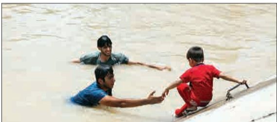
شهر ملاتانی در ۲۵ کیلومتری شهر اهواز، مرکز استان خوزستان قرار دارد. این شهر در بیشتر ماه‌های سال با گرمای بالای ۵۰ درجه درگیر است. جوانان این شهر برای فرار از گرما در کانال‌های سیمانی که برای آبیاری زمین‌های کشاورزی استفاده می‌شود به شنا می‌پردازند؛ کانال‌هایی که عموماً آلوده هستند و شنا کردن در آن ممنوع اعلام شده. (ایستا)