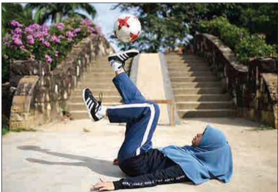
تمرین باتوپ در پارک در کوالالامپور مالزی