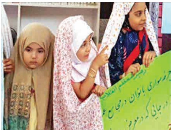
مسابقات دوچرخه‌سواری کودکان دختر زیر ۱۱ سال در شهر تکاب به علت اعتراض عده‌ای از سوی تربیت‌بدنی این شهرستان لغو شد.