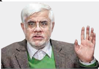
محمد رضا عارف خبر داد: حل و فصل حصر

محمد رضا عارف، رئیس فراکسیون امید می‌گوید: در میان مسئولان حتی دوستان اصولگرا عزمی وجود دارد که مسأله حصر حل و فصل شود و امیدواریم در آینده نزدیک این اتفاق بیفتد. مابک زمان بندی داریم و با حوصله موضوع را دنبال می‌کنیم. طبیعتاً هیچ مانعی برای ملاقات با رهبری قابل نیستیم، البته اگر به نتیجه برسیم، باید تقاضا کنیم و اگر ایشان امر فرمودند، خدمتشان برسیم.