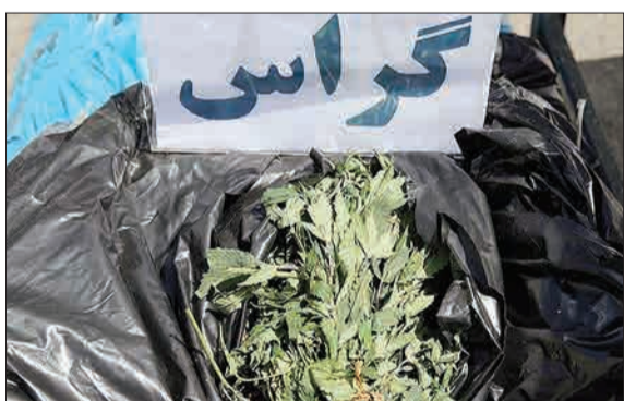
کشف ۲ تن مواد مخدر در تهران.