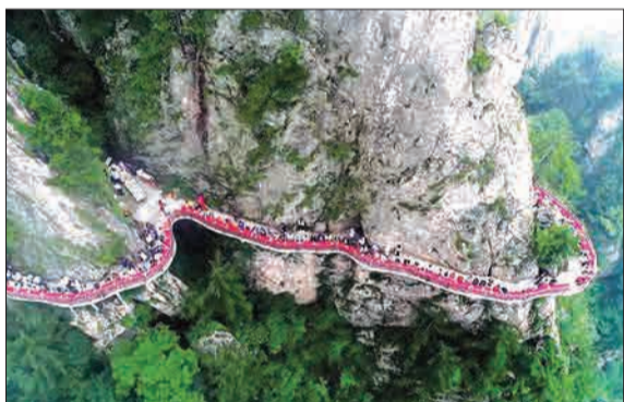
پذیرایی از مردم چین بر لبه یک صخره در ارتفاع ۱۰۰۰ متری. (انتخاب)