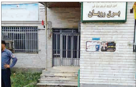
یک نانوا در شهر نور مازندران در اعتراض به قطع مکرر برق، خمیرهای خود را روی پلهای اداره برق پهن کرد! (جماران)