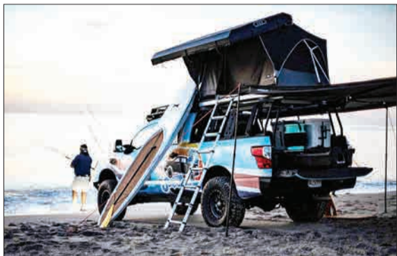
تابستان شروع شده و همه در سر اسر دنیا به فکر یک سفر خوب کنار دریا هستند. نیسان نیز در این راستا خلایقیت به خرج داده و تمام تلاش خود را برای ساخت یک مدل از پیک آپ‌های خود خرج کرده است تا یک کمپرون مسافرتی را به جهان ارائه دهد. (عصر ایران)