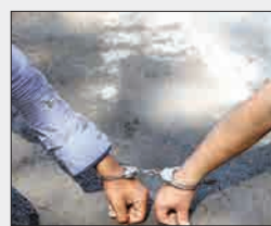
عکس از روز شنبه ۱۳۹۷ تیر ۲