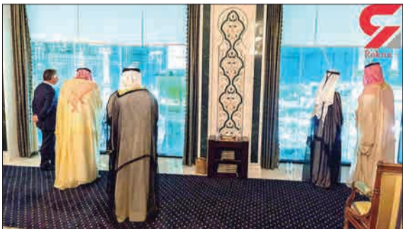
تصویری که به تازگی در فضای مجازی منتشر شده، سران کشورهای عربی را در حال تماشای تکیه از هتل مشرف به مسجد الحرام نشان می‌دهد. در این تصویر از چپ، ملک عبدالله (پادشاه اردن)، ملک سلمان (پادشاه سعودی)، امیر کویت، شیخ محمد (حاکم دبی) و محمد بن سلمان (ولیعهد سعودی) ایستاده‌اند.