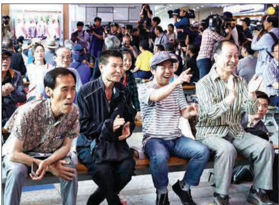
مردم کره شمالی در حال تماشای مذاکرات رئیس‌جمهوری کشورشان با ترامپ