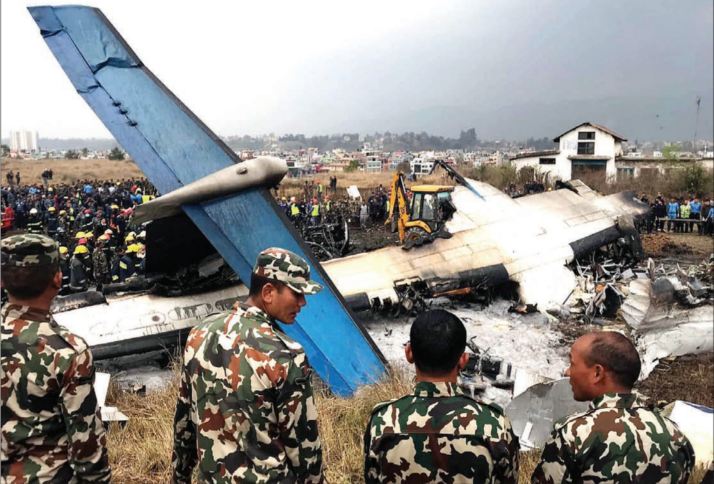
هواپیمای بنگلادشی هنگام نشستن در فرودگاه تریبون کاتماندو پابخت نیال، از باند خارج شد و بعد از برخورد به حصارهای دوریک زمین فوتبال آتش گرفت. این هواپیما ۶۷ مسافر و ۴ خدمه داشت که از این تعداد ۴۹ نفر جان خود را از دست دادند.