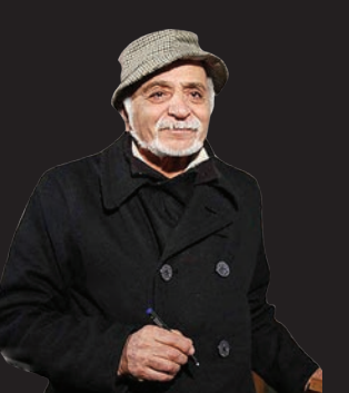
همایون شهناز در گذشت

شهرنوا | همایون شهناز، کارگردان سرریال دلبران تنگستان و فیلم شاه خاموش که گفته می‌شد برای پیکبری مطالباتش از صداوسیما به ایران بازگشته و مدتی پیش در ساحت‌های در منزلش دچار سوختگی شده بود، در بیمارستان درگذشت.