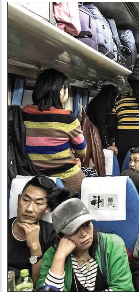
در آستانه حلول سال نوچینی، این کشور با افزایش سرسام آور سفرهای داخلی روبه رو شده است. در تصویر مسافران که سوار بر قطار از یک رانهای چنگدو هستند در وضعیتی فشرده و برخی نیز ایستاده راه را می پیمایند؛ آن هم بر ای سفری ۲۶ ساعته؛ عکس: فرد دو فور / AFP