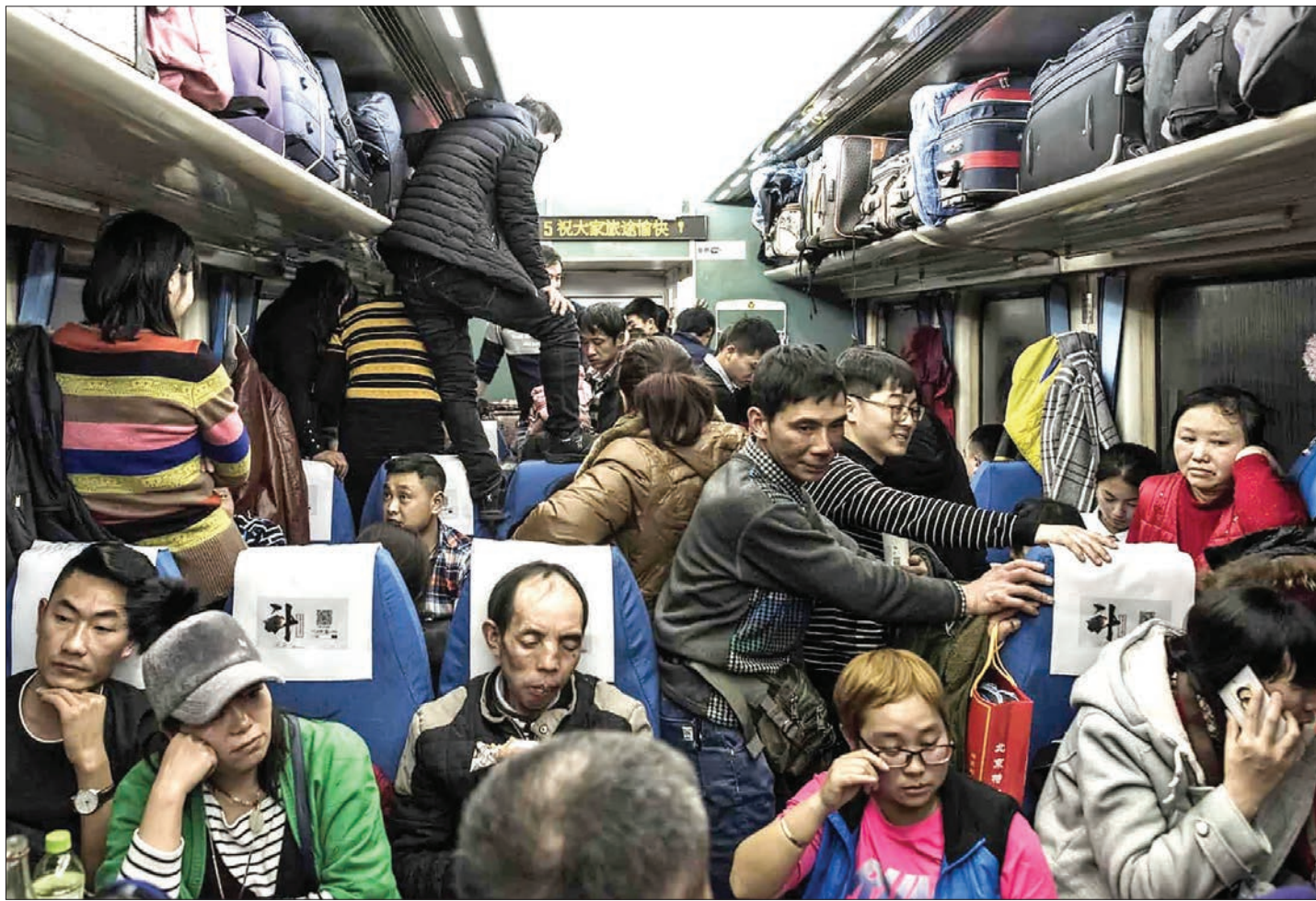
در آستانه حلول سال نوچینی، این کشور با افزایش سرسام آور سفرهای داخلی روبه رو شده است. در تصویر مسافران که سوار بر قطار از یک رانهای چنگدو هستند در وضعیتی فشرده و برخی نیز ایستاده راه را می پیمایند؛ آن هم بر ای سفری ۲۶ ساعته؛ عکس: فرد دو فور / AFP