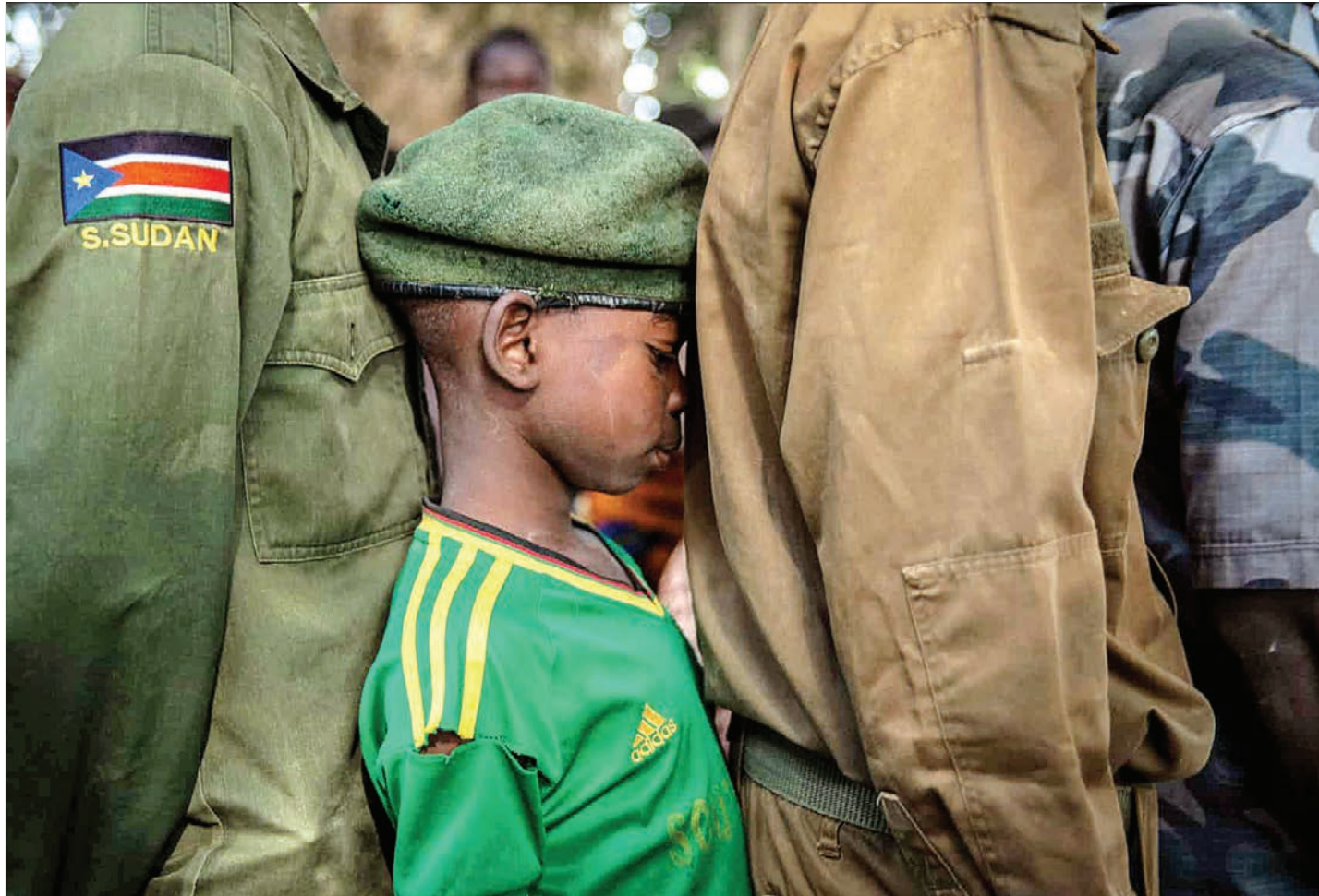
▲ در آفریقا پس از چهار ماه از مرد می شوند حضور این کودک در صحنه متقاضیان خدمت در ارتش سودان جنوبی می کنند.