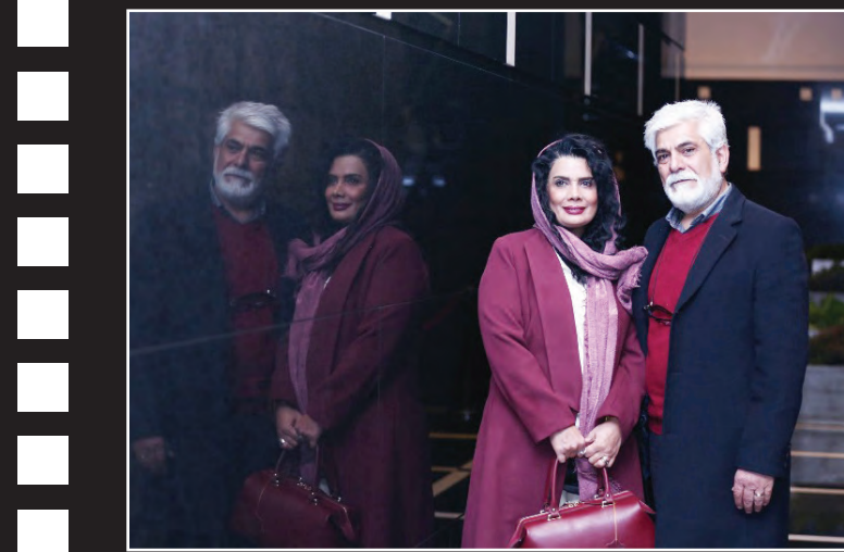
اکران خصوصی فیلم «خانه کافکی» به کارگردانی مهدی صبیغ زاده و تهیه‌کنندگی تینا پاکروان در خانه همايش برگزار شد.