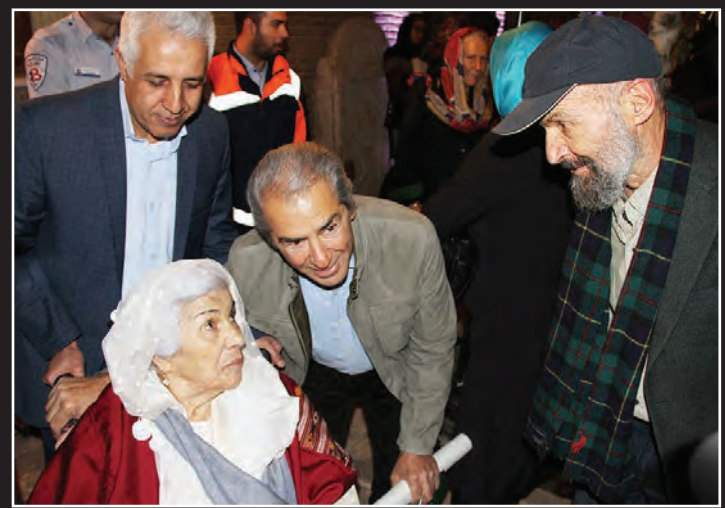
تالار مشیر شاهرودی فرمانفرمایان، عصر جمعه ۲۴ آذر ماه در باغ نگارستان در نود و پنجمین سال زندگی هنرمند، گنجایش یافت.