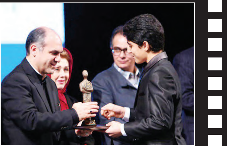
چهارمین جشنواره و جایزه همایون فرخ (نوی خرم) با معرفی برگزیدگان برگزار شد.