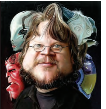
دل نورو و پيشنار گلدن گلوب شد

شهرودا نامزدهای جوایز سینمایی گلدن گلوب که به انتخاب انجمن مطبوعات خارجی هالیوود اهدا می شود، معرفی شدند. مطابق اخبار منتشر شده، در میان نامزدهای اعلام شده از سوی دست اندرکاران برگزار، فیلم شکل آب، ساخته گی برمو دل نورو با نامزدی در ۷ رشته پیشناز است.