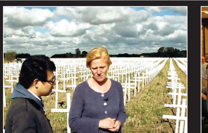
مستند بی نظمی طبیعی محصول کشور داتمارک در سومین روز جشنواره سینما حقیقت روی پرده می رود.