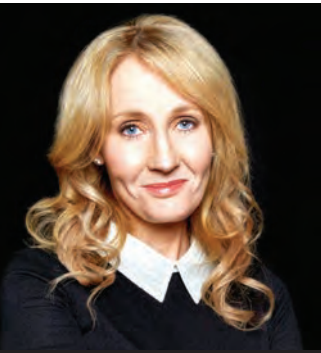
زندگی و رولینگ فیلم می شود!