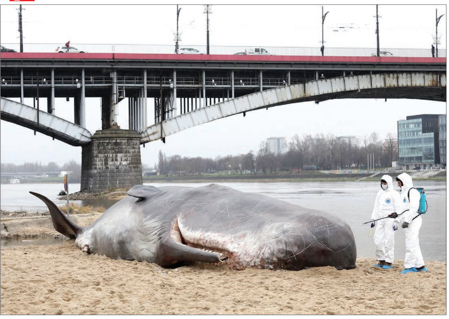
یک گروه هنری بلژیکی با ساخت مجسمه‌های از یک نهنگ عمبر (با ابعاد واقعی) در ساحل رودخانه شهر و آرسای لهستان، نسبت به آلودگی آب‌ها و تخریب اکوسیستم جانوری اعتراض کردند.