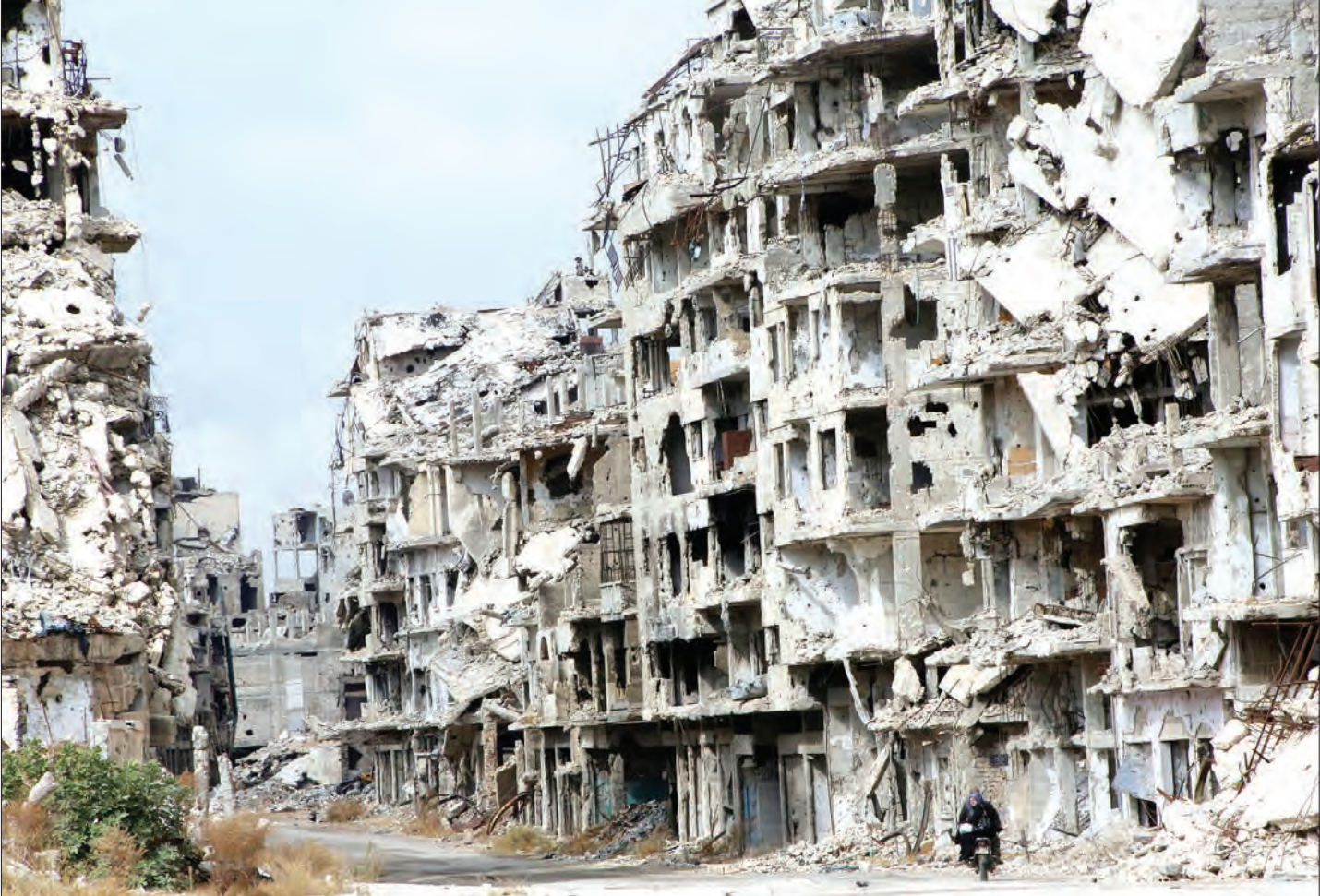
تصاویری از شهر حلب، با آنچه مانده حلب نامیده می‌شد پایتخت اقتصادی سوریه. یک سال پس از آن آزدسازی شهر توسط نیروهای مقاومت و ارتش سوریه، مردم آرام آرام به زندگی عادی و خانه‌های خود باز می‌گردند.