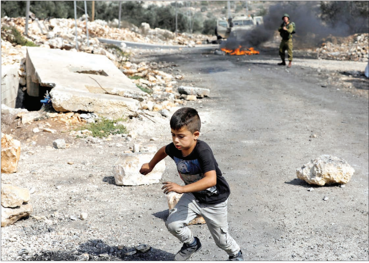
فلسطین، کرانه باختری، سنگ، شلیک، نابلس، سربازان، کودک، کودک، کودک، فردا این استان ۷ سال گذشته سرزمین مقدس، عکس: محمدتورکمان/Reuters