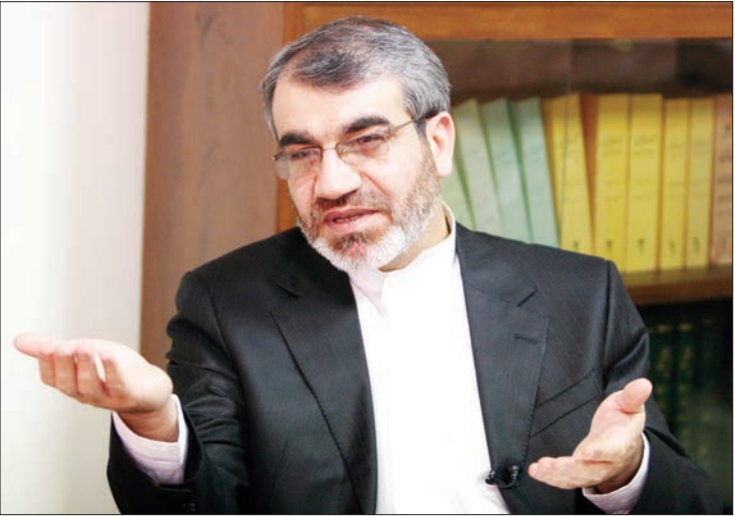
عباسعلی کدخدایی سخنگوی شورای نگهبان

◀ میرزایی نکو: به حل موضوع سپنتا نیکنام امیدوار نیستم ▶