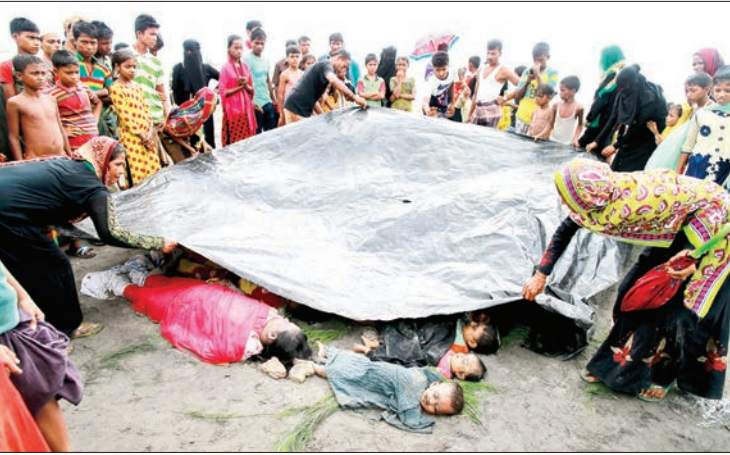
خواهد شد. این خبر را مسئولان هلال‌احمر اعلام کرده‌اند. همچنین محموله ۱۰۰ تنی جمعیت هلال‌احمر ایران برای مردم میانمار

میانمار همراه با محموله دوم اعزام خواهند شد. پیشتر مسئولان عالی هلال‌احمر جمهوری اسلامی ایران از رایزنی وسیع با سفیر بنگلادش و قول مساعد او برای همکاری با هلال‌احمر ایران خبر داده بودند. دبیرکل هلال‌احمر هم از ایجاد کارگروهی امدادی به همین منظور خبر داده بود. کارگروهی که در بالاترین سطح ایجاد شده و کمک به مسلمانان روهینگا را در دستور کار خود قرار داده است. منابع خبری در گزارش‌های مستمر، وضع مسلمانان این کشور را استفاک توصیف کرده‌اند. گفته شده برخی محدودیت‌ها برای این گروه از مسلمانان در عبور از مرزها اعمال شده است. طی روزهای گذشته با شروع دور جدید از حمله نظامیان و بودایی‌های میانماری، انتقادات شدیدی علیه «سوجی» برنده میانماری صلح نوبل آغاز شده است. گفته می‌شود فعالان صلح معتقدند باید این جایزه از سوجی پس گرفته شود.