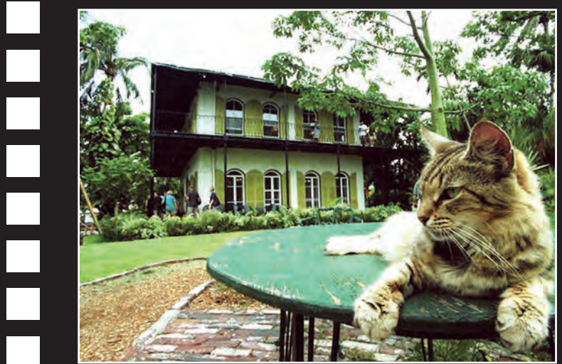
تمام ۴۵ گربه ای که در گذشته سابق همیگویی زندگی می‌کنند، به گزارش هافینگتون پست توانسته اند از طوفان مرگ بزرگ جان سالم به در ببرند