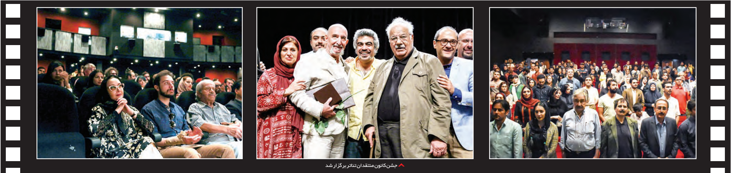
جشن کانون منتقدان تئاتر برگزار شد