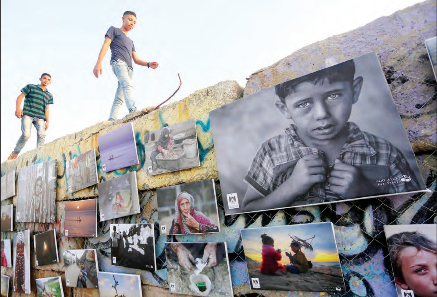
در حالی که این روزها اخبار عملیات شهداد طلبه سده جوان فلسطینی در مسجد الاقصی سر تیر خبرهای مربوط به فلسطین اشغالی را به خود اختصاص داده، برگزاری نمایشگاه «هزاران عکس از شهر محاصره شده» در فضای باز شهر غزه، نوعی دیگر از مبارزه را به نمایش گذاشته است.