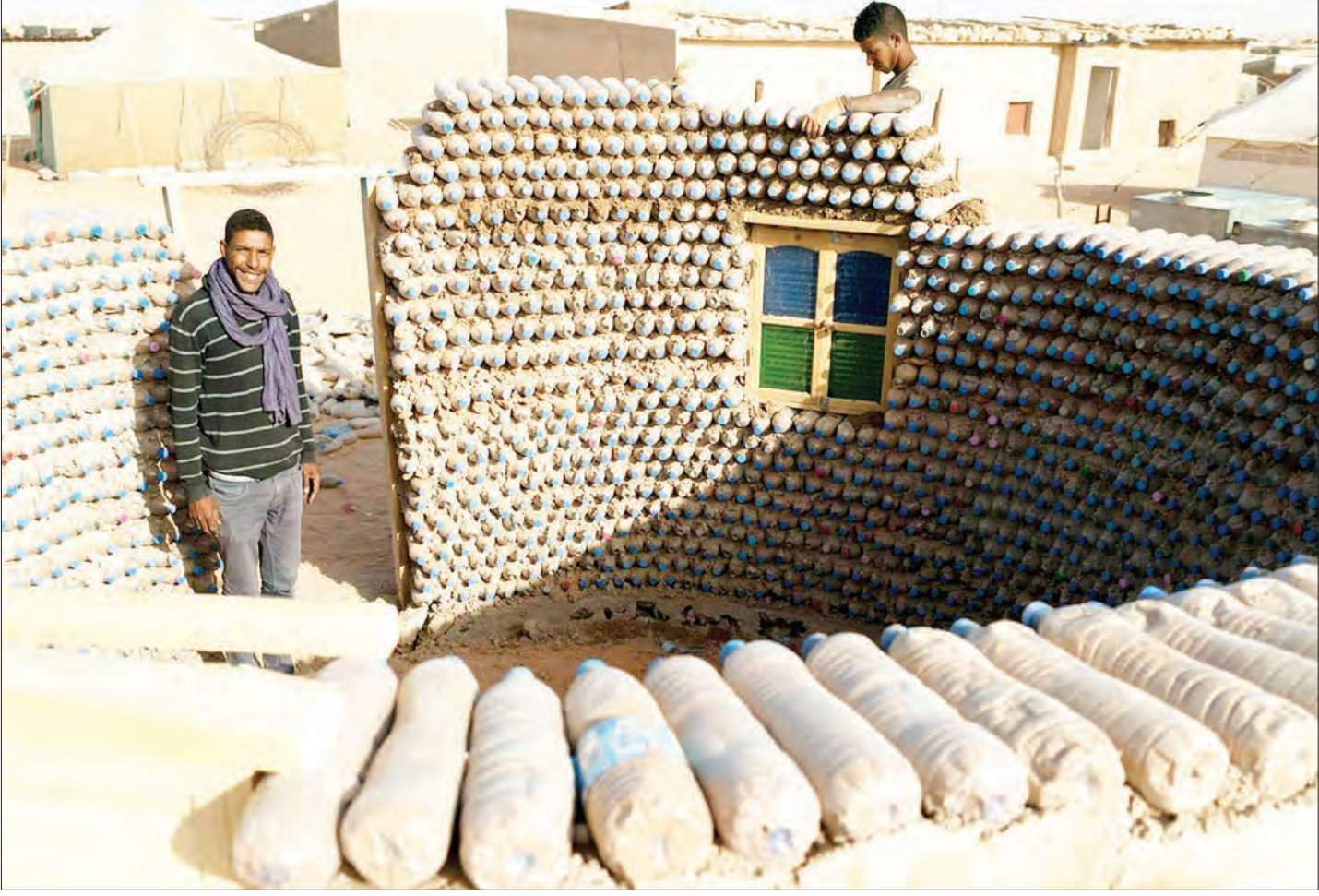
ایبیبی و استفاده از بطری های پلاستیکی ملو از خاک به جاست خانه، یکی از فرتمندترین کشورهای قاره آفریقا بعد از سرنگونی زامبادا دیکتاتور خود دیگر روی آرمش و رفاه به خود ندید، این شاید سر نوشت محتوم همه ما تانی باشد که می دانند چمنی خواهند و نمی دانند که چه می خواهند، عکس: پاپولواکستا/ElPais