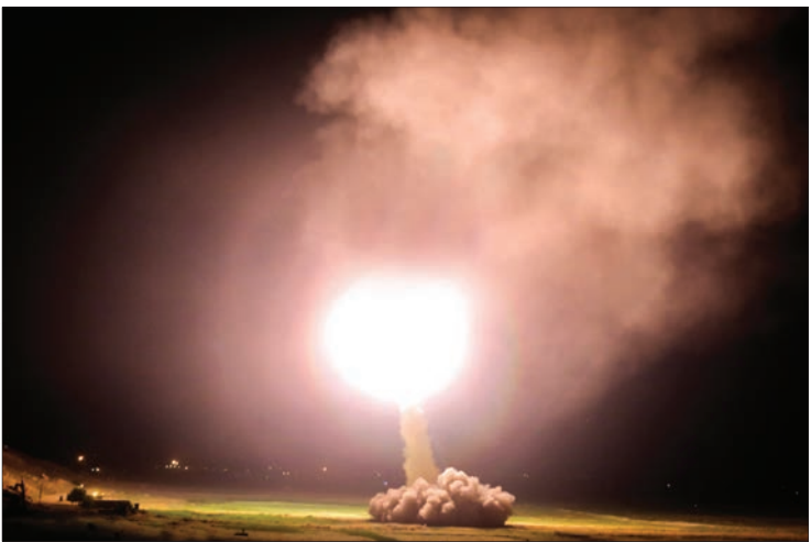
عصر پنجشنبه ۳۰ خرداد ۱۳۹۶، تهران، ایران

◀ فرمانده نیروی هوافضای سپاه: تمامی موشک‌ها به هدف اصابت کرد