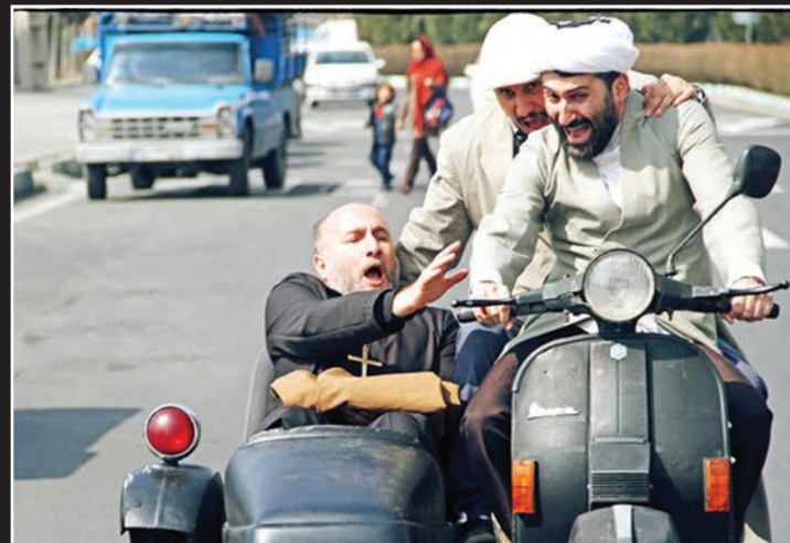
فیلم سینمایی «اکسیدان» که قرار است از ۳۱ خرداد اکران عمومی شود، در یک اکران خصوصی رونمایی شد؛ فیلمی به تهیه‌کنندگی منوچهر محمدی که با حال و هوای «مارمولک» ساخته شده است.