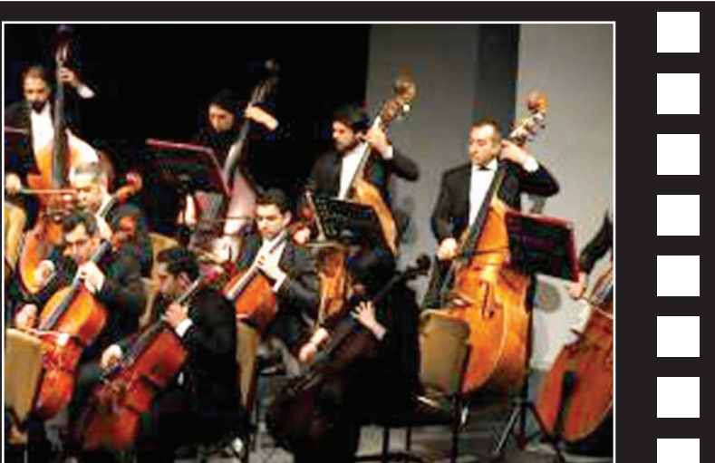
ارکستر سمفونیک تهران در ایام ارتحال امام خمینی (ره) «سمفونی روح اله» ساخته شاهین رفعت را در تالار وحدت تهران اجرا می‌کند