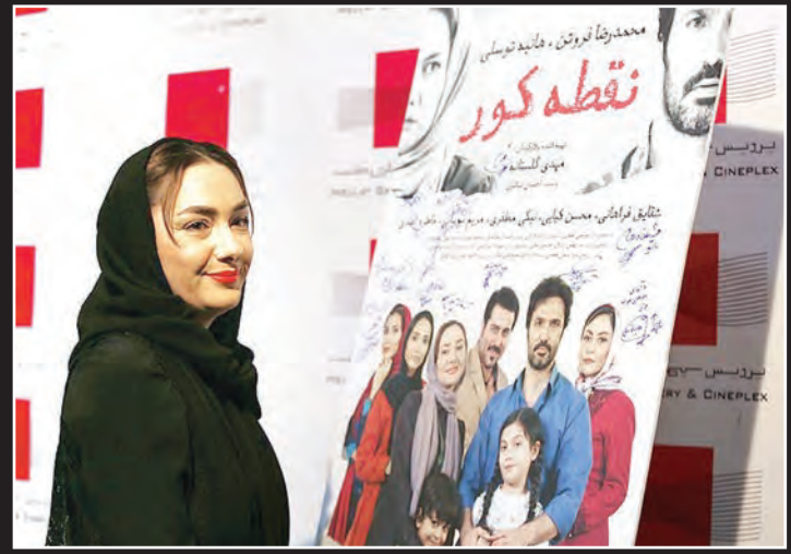
اکران افتتاحیه فیلم سینمایی نقشه کور شب گذشته در پردیس سینمایی ملت برگزار شد.