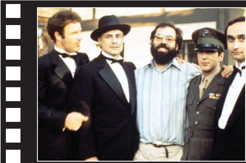
جشنواره در اینجا اعلام کرد بر نامه شب آخر این دوره را که به نشست استیاز دست اندر کاران فیلم پدیر خوانده، در چهل و پنجمین سال ساخته شدنش اختصاص داد. مستقیم از فیسبوک پخش می‌کند.