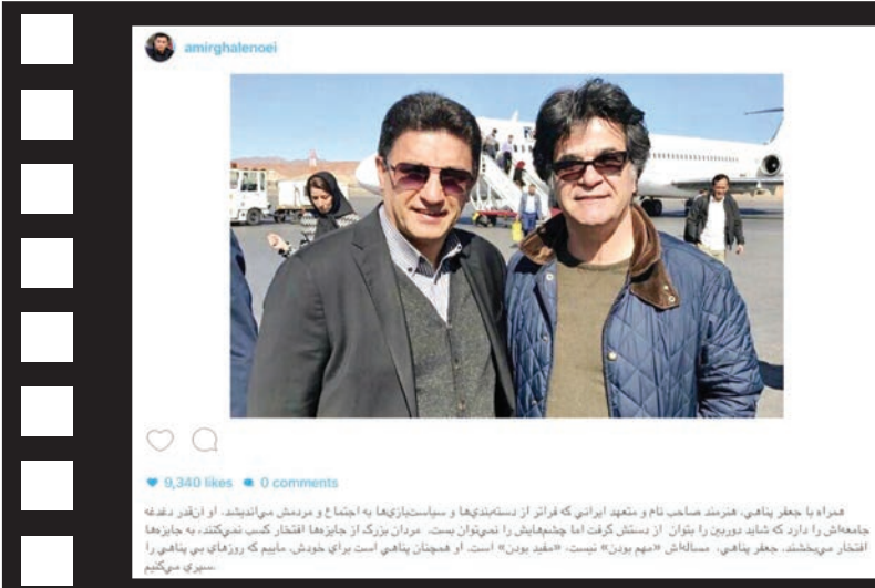
امیر قلعه‌نوچی با انتشار عکس دو نفر ه‌شان با جعفر پناهی او را افتخار جوایز سینمایی نامید.