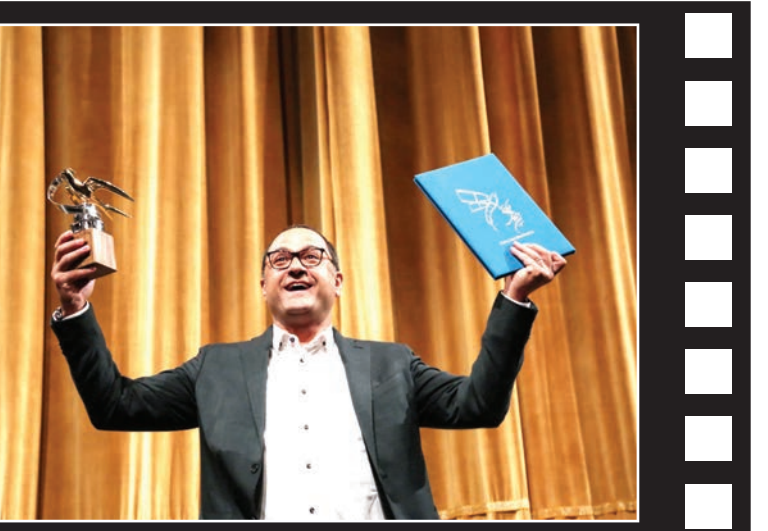
در آیین اختتامیه سومین جشنواره ملی فیلم «سما» از امد جوان هنرمند سینما و تلویزیون تجلیل شد.